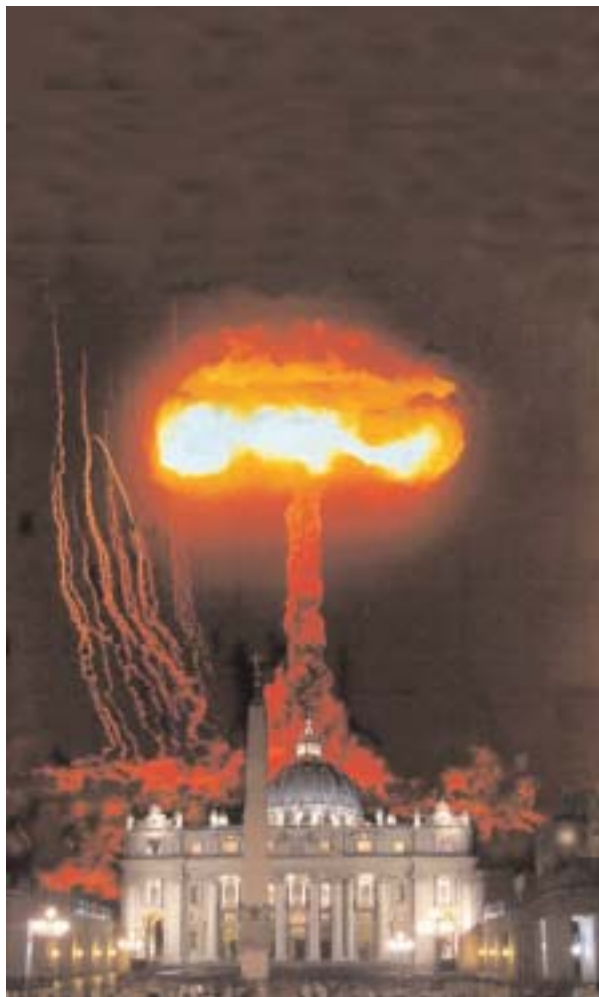
¿Fue utilizada la amenaza de una bomba atómica sobre el Vaticano para alejar a Giuseppe Siri de la Cátedra de Pedro?

«Hay también tropas italianas que combaten contra los Rusos, nuestros aliados. Un bombardeo total (como el de Berlín) de la capital italiana parece no sólo auspicioso sino necesario. Actualmente, la común convicción de que Roma será sólo marginalmente tocada por nuestros bombarderos está provocando una enorme concentración de los peores elementos del orden fascista en Roma y sus alrededores.