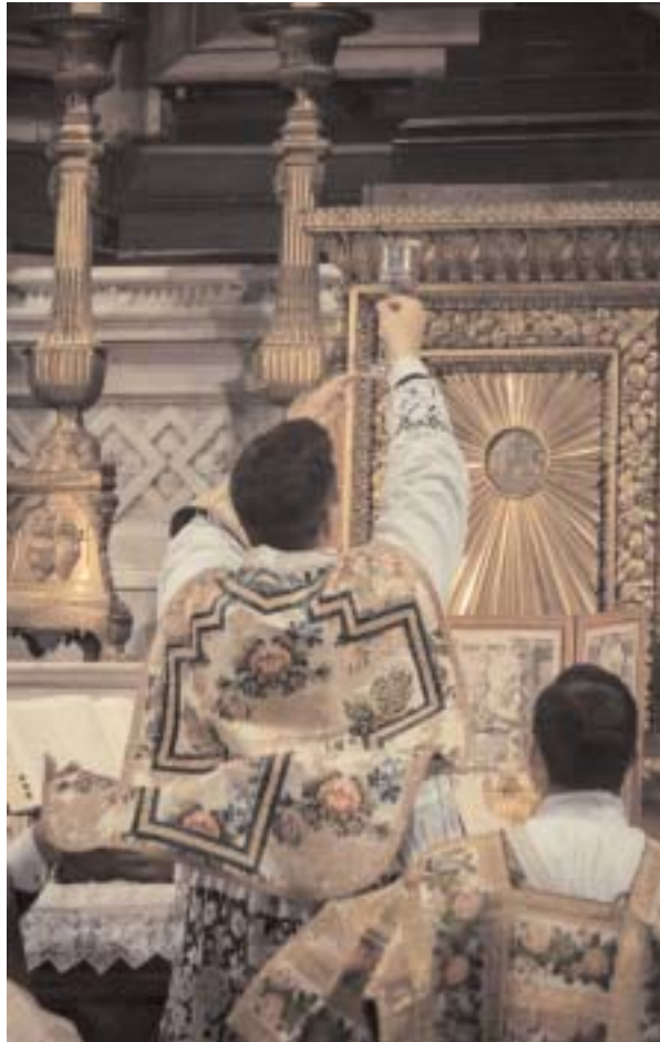
El Santo Sacrificio de la Misa.

conservadores, en particular los que sabían que su imposición en la Cátedra de Pedro debido a la interferencia de los poderes seculares fuera de la Iglesia, había arruinado el Cónclave y producido un antipapa. Pero la traición de Roncalli, ante los padres conciliares, pasó a segundo plano, apenas estalló el éxito de su re-introducción en la escena mundial como el gran “artífice de la paz” y negociador para la superación de la “Crisis de los misiles de Cuba”, reforzando ulteriormente el título que le fue conferido por los medios de comunicación controlados: el “Papa Bueno Juan XXIII”. Obviamente preparada por sus gestores y la prensa adepta, Roncalli propuso primero al Kremlin, luego a Washington que los misiles americanos en Gioia del Colle, Italia (que era una provocación de los Estados Unidos contra la Unión Soviética que había llevado a la instalación de misiles rusos en Cuba como medida de reequilibrio