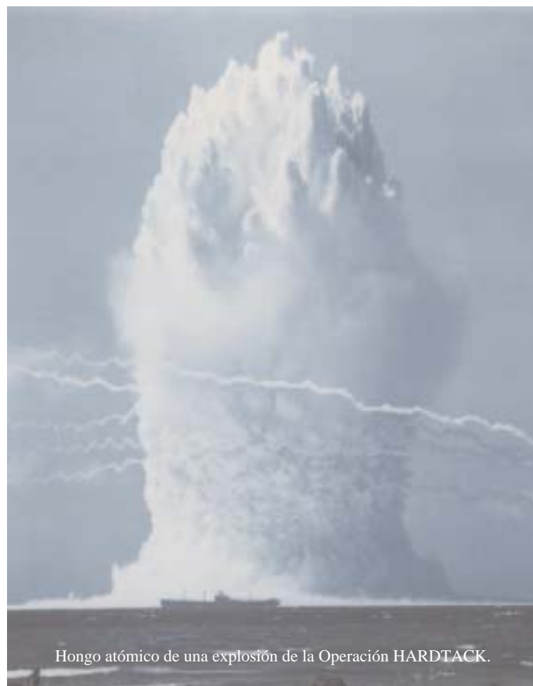
Hongo atómico de una explosión de la Operación HARDTACK.

«HARDTACK era la denominación de los Estados Unidos para los tests nucleares en el Pacífico y en Nevada, durante 1958. La Fase I, discutida en esta sección, se compone de 34 detonaciones nucleares en el Pacífico, la misma can-