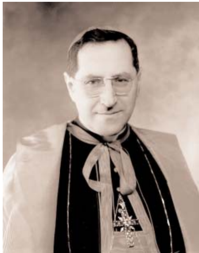
El card. Giuseppe Siri en 1955.

Aunque realizada en las habitaciones cerradas del Cónclave, la elección del nuevo pontífice había sido anunciada públicamente al mundo con señales de humo blanco, que