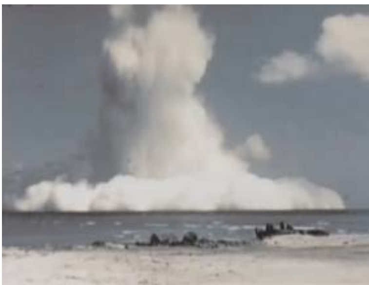
Hongo atómico de una explosión HARDTACK.

«La operación ha demostrado la validez de la teoría de Christofilos. Ella no sólo ha provisto datos sobre consideraciones de carácter militar, sino que también ha producido una gran cantidad de informaciones geofísicas (20: 2).