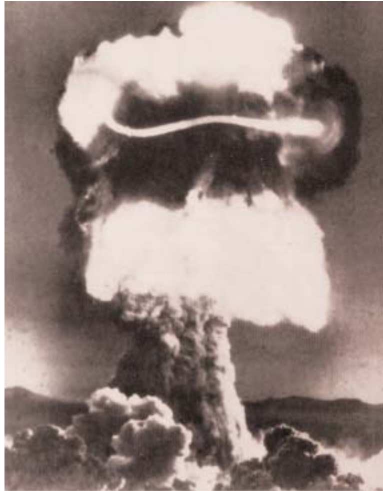
El hongo atómico de la explosión de la bomba arrojada sobre Hiroshima.

Antes de su muerte, sin embargo, Siri cambió de idea y sostuvo la abolición del cónclave secreto. Evidentemente, se había dado cuenta de que el aislamiento del Cónclave había cumplido su tiempo, durante la última parte del 20° siglo. Porque ahora había facilitado los planes de los enemigos de la Iglesia – que se habían “infiltrado” en los