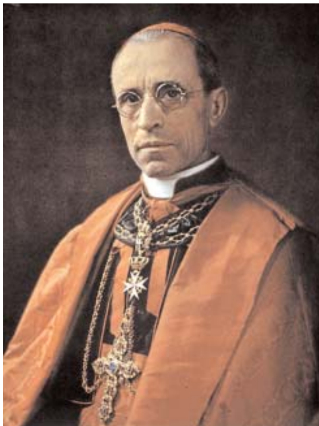
Papa Pío XII.

En sus escritos esotéricos, hacia el final de su vida, Alice B. Bailey , la ex alta sacerdotisa de lo que hoy es conocido como la “New Age”, ha expuesto desfachatadamente las fuerzas ocultas que dominan la ofensiva masónica para la creación de un gobierno mundial anti-cristiano . En