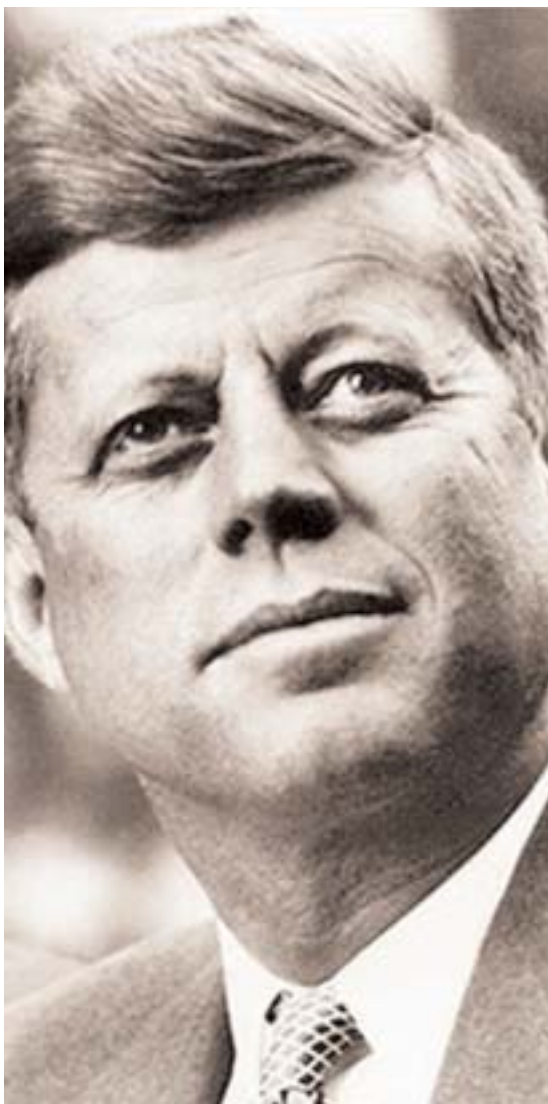
J.F. Kennedy en 1962.

«Los soviéticos no tenían ningún equipo para esta producción en masa, y ni la Urss ni ningún otro productor europeo era capaz de producir tales equipos... » 15 .